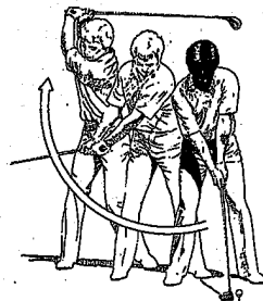
ワン・ピース・スイングを身につけよう